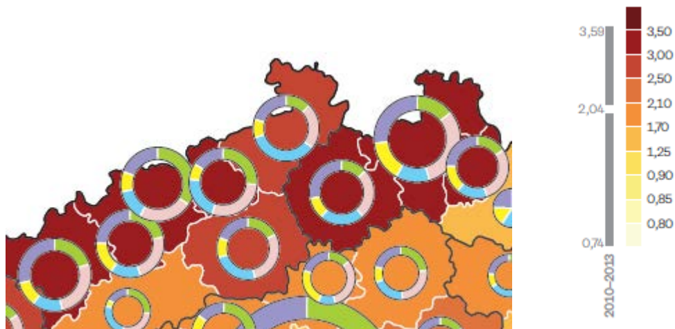
Obrázek 2: Násilná kriminalita v severních Čechách v letech 2010–2013 (výřez)